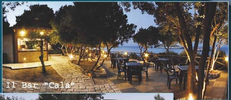
Il Bar "Cala"