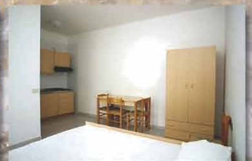
Le villette belvedere