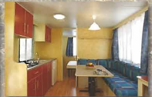
Le Case mobili