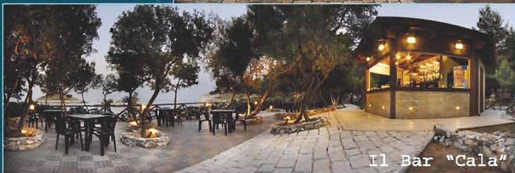
Il Bar "Cala"